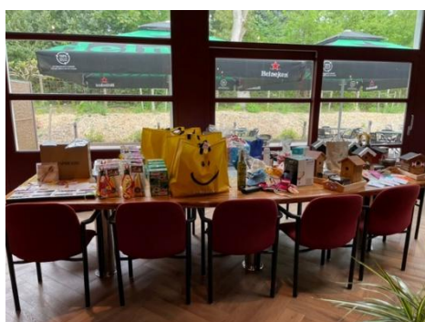
De prijzetafel in 2023

Het maximum aantal deelnemende paren is 60. De inschrijfkosten bedragen € 35 per paar. Deelnemers worden ontvangen met koffie/thee en petitfour. Tijdens het toernooi worden lootjes verkocht, er zijn mooie prijzen te winnen in de loterij.